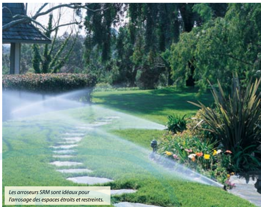
Les arroseurs SRM sont idéaux pour l'arrosage des espaces étroits et restreints.