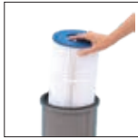
Élément filtrant facile à retirer