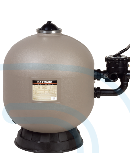
ProSeries™ HB Side