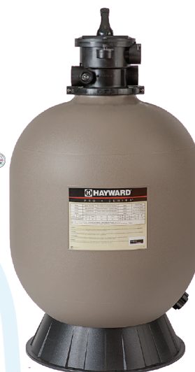
ProSeries™ HB Top