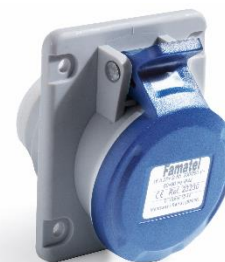
Ref. / Item 23230