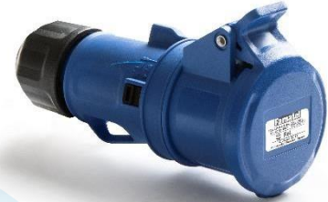
Ref. / Item 23200