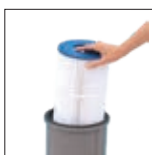
Élément filtrant facile à retirer