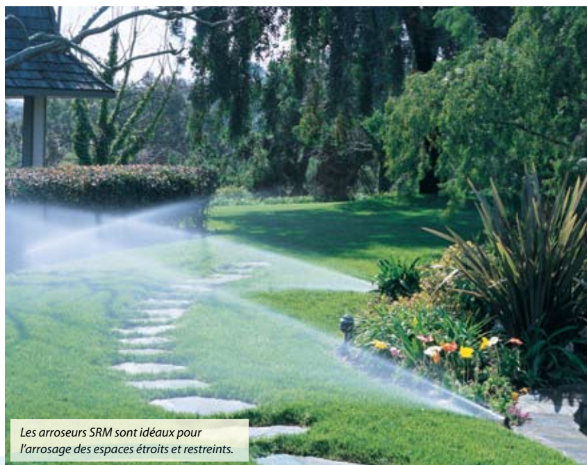
Les arroseurs SRM sont idéaux pour l'arrosage des espaces étroits et restreints.