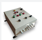
Coffret de relevage