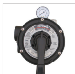
Vanne Vari-Flo™ 6 positions