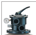
Sable facilement accessible grâce au collier de démontage