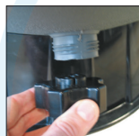
Drain avec son bouchon de grande dimension servant d'outil de démontage