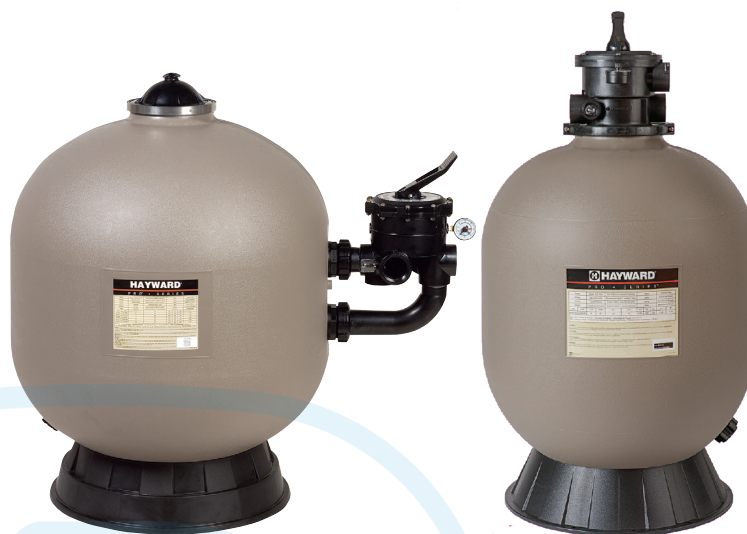
ProSeries™ HB Side