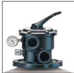
Sable facilement accessible grâce au collier de démontage