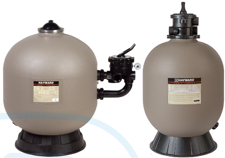
ProSeries™ HB Side