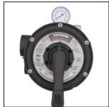
Vanne Vari-Flo™ 6 positions