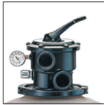
Sable facilement accessible grâce au collier de démontage