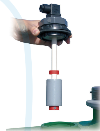
Interrupteur de niveau vertical