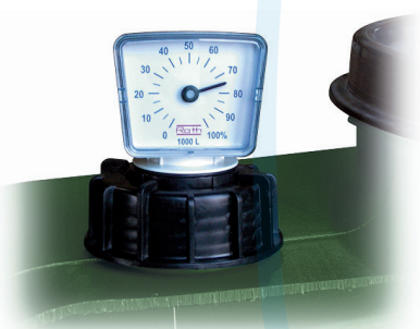
Indicateur de niveau mécanique