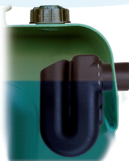
Siphon de trop-plein DN100