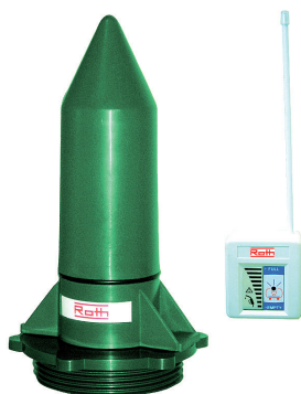
Rothalert®, indicateur de niveau sans fil