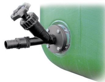
Kit Robinet 1''